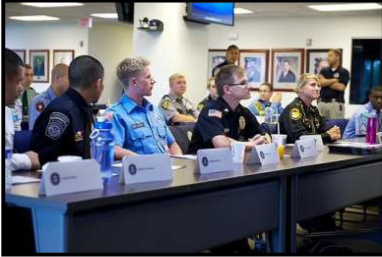
Academia de Liderazgo Policial

Con el tiempo, los cursos de formación han evolucionado para incluir horas adicionales centradas en temas como la intervención en crisis, la diversidad cultural, la ética, la policía de proximidad, las técnicas de desescalada, la resolución de conflictos y la sensibilidad cultural, entre otros.