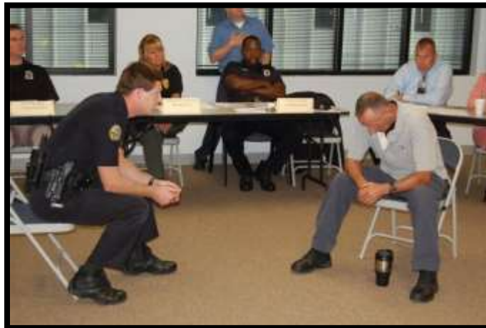
Formación en Intervención en Crisis

La formación en intervención en crisis para las fuerzas del orden sigue cambiando en respuesta a los mandatos legislativos, los cambios sociales, la mayor concienciación pública sobre los problemas de salud mental y la necesidad de que los agentes gestionen eficazmente las situaciones de crisis.